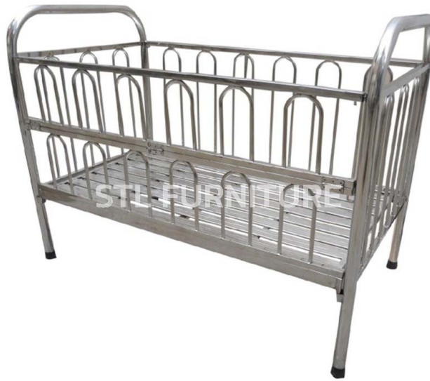
เปลสแตนเลส